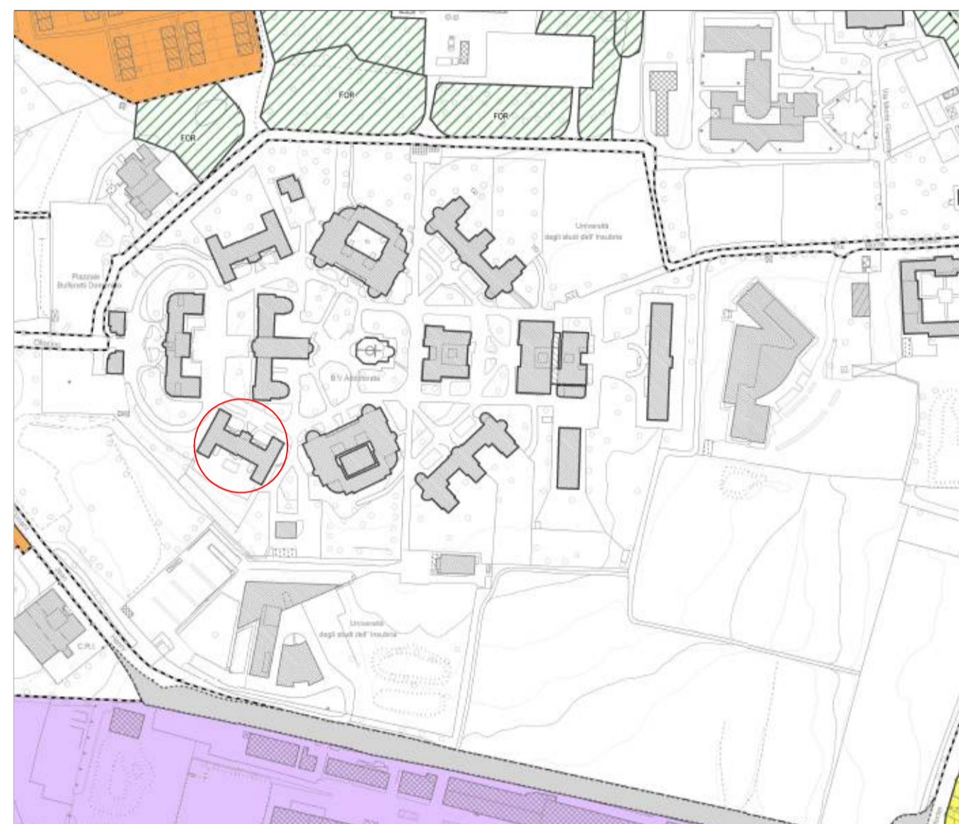
ESTRATTO PGT - PIANO DELLE REGOLE FG. 40 - SANTA MARIA MADDALENA AREA A SERVIZI CON EDIFICI A RILEVANTE INTERESSE STORICO ARCHITETTONICO 1934-1953