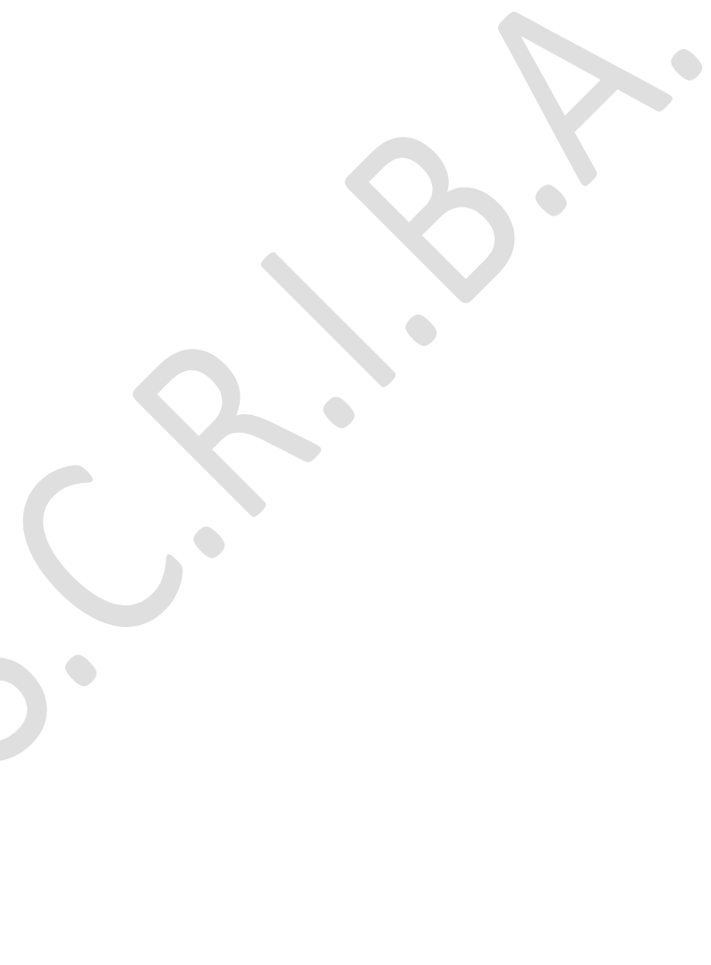
F.to Il Responsabile Economico Finanziario ai sensi D.Lgs. 39/93